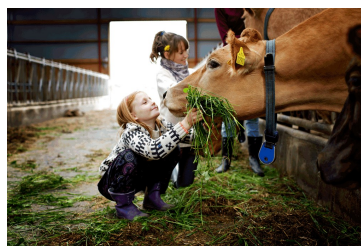
Billede 4. Det animalske med mælke- og kødproduktion.