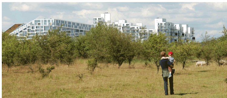
Billede 1.

Se 'European Agricultural Fund for Rural Development'