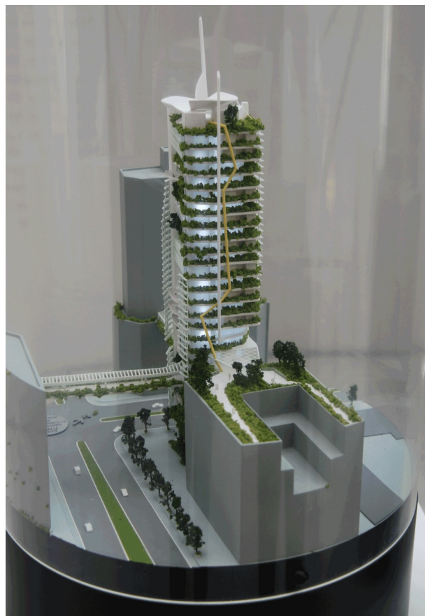
Billede 5. Eksemplet er fra en idékonkurrence om Urban Farming, Her illustreret ved en model. Foto: Kræn Ole Birkkjær, VFL.

I medierne har der indimellem været indslag om projektideer fra store bysamfund rundt om i verden. Nye typer højhuse med en kombination af bosætning og landbrugsproduktion er vigtige at få gennemanalyseret, dokumenteret og designet.