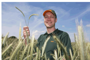
Billede 3. Det vegetabilske med dyrkning af korn og rodfrugter.

Natur- og miljøtiltag i urbane omgivelser (8MB)